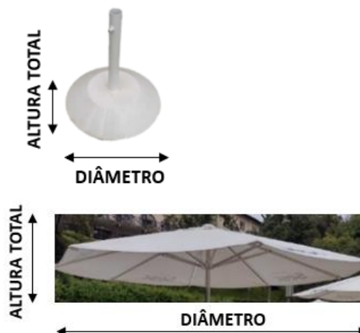
Figura 4 Ombrelones + Bases (imagem meramente ilustrativa)