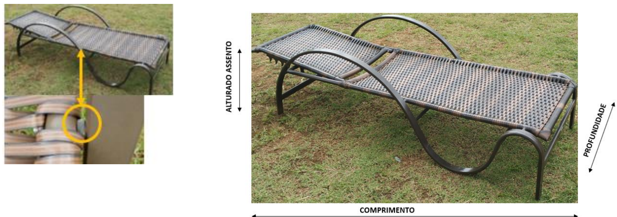
Figura 3 Espreguiçadeira (imagem meramente ilustrativa)