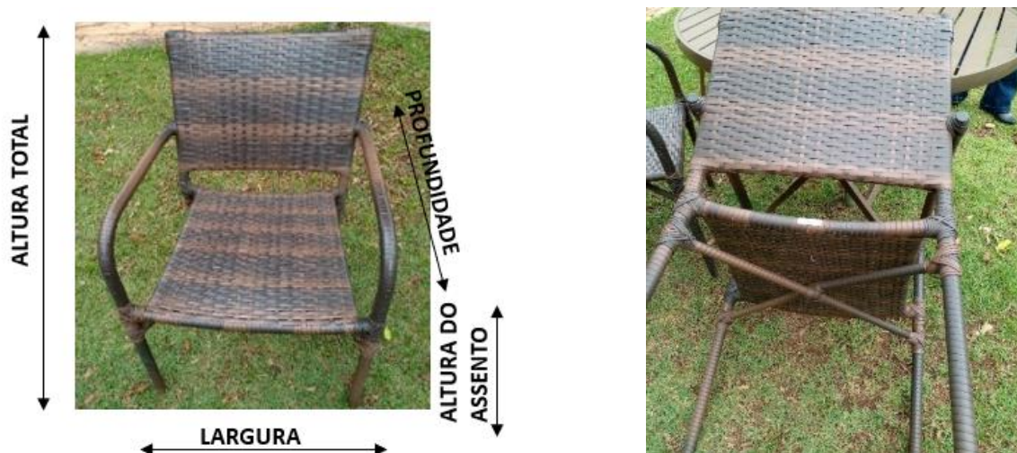
Figura 1 Cadeira (imagem meramente ilustrativa)